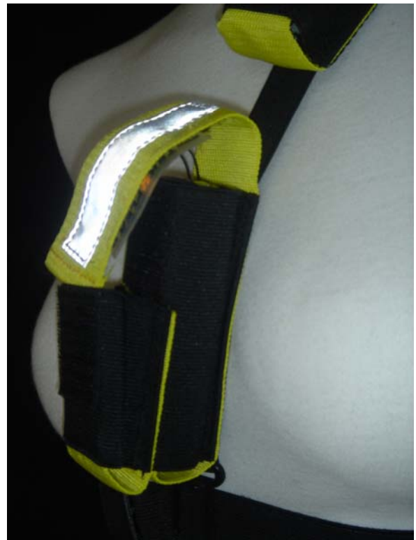
Stor och liten ficka sett från sidan.